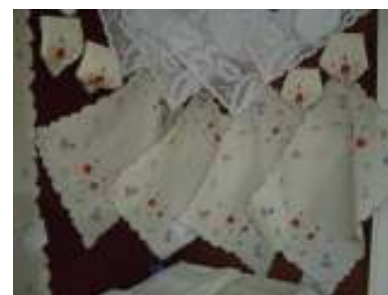
民族衣装の子供は刺しゅうの定番。