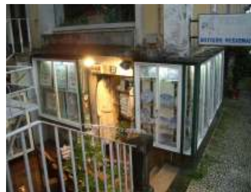
シントラバザール入り口