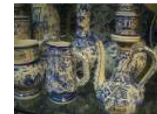
ポルトガルの伝統的な、陶器類 ユニークな表情の動物シリーズは、見逃せない逸品。