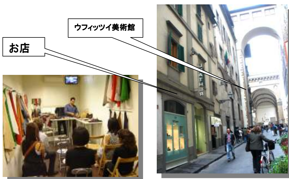
レザーファクトリー